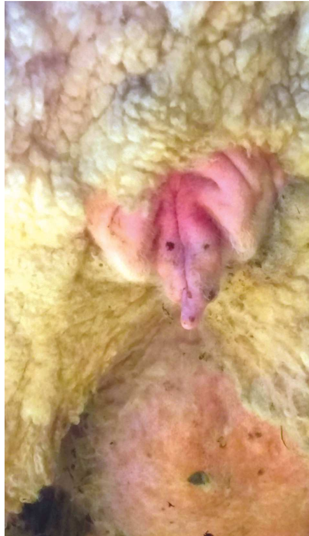
Ejemplo de cortes de cola en ovejas: uno, correcto, que cubre vulva; otro, excesivamente corto.

y tomar medidas para resolverlas. Los animales diagnosticados con miasis deben ser tratados inmediatamente después del diagnóstico.