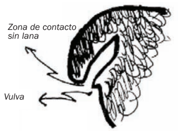
Fig. 3.1: Cola cortada largo correcto. La zona de contacto vulva-cola está libre de lana para evitar acumulación de materia orgánica.