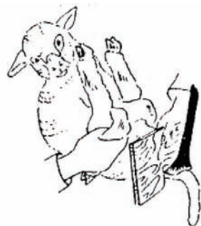
Fig. 2: Formón o pinza candente (Extraído de H.T. Carroll, "Enfermedades de los ovinos", 1957)